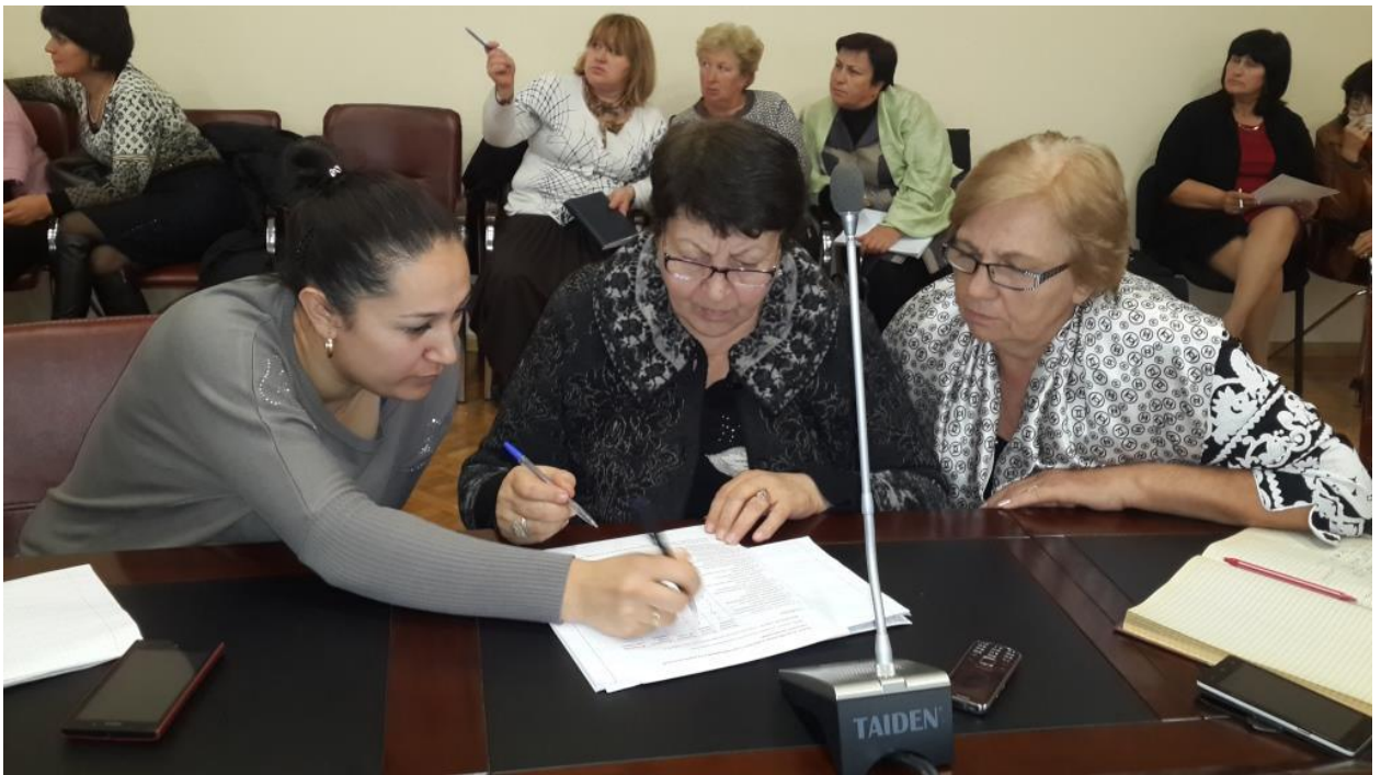
Блиц-игра «Я создаю ситуацию успеха для развития личности ребенка».