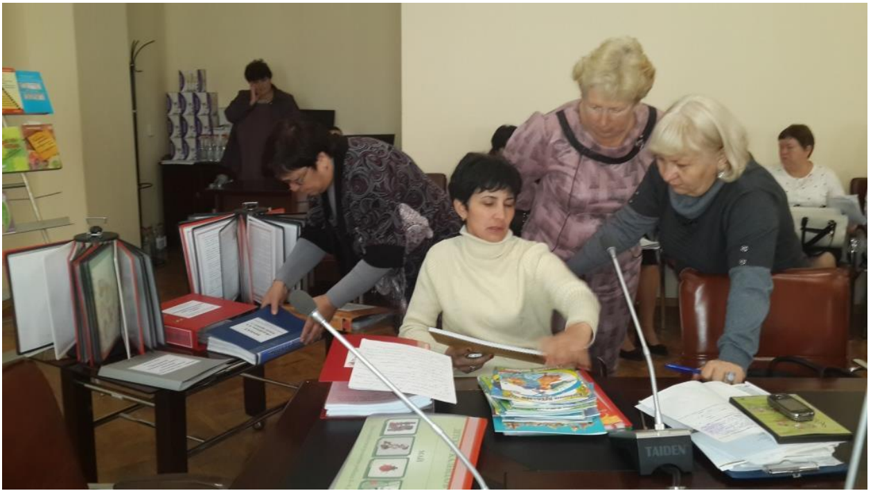
Слушатели курсов поделились опытом работы с «Детским календарем».